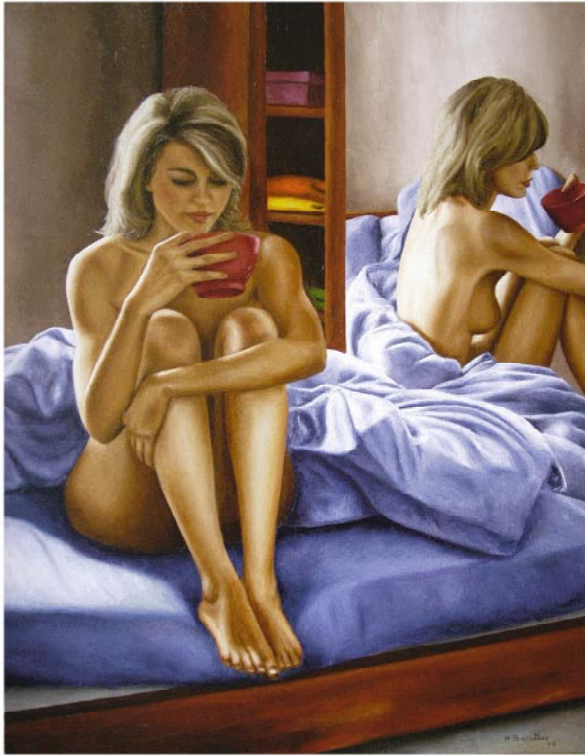
7 h 20 2005 . Huile sur toile . 116 x 89 cm