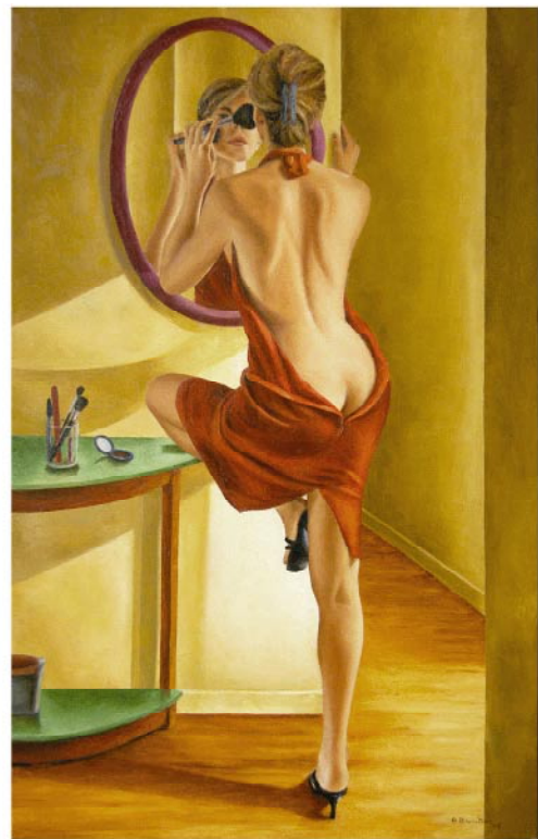
20 h 10 2005 . Huile sur toile . 116 x 73 cm

Artclub Gallery - 172 rue de Rivoli, 75001 Paris